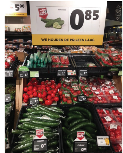
Periode 3: geen bord, zelfde prijs kromme als rechte komkommers