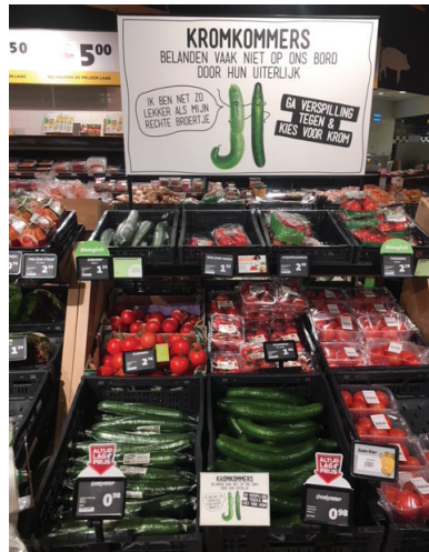
Periode 2: bord met uitleg en media aandacht, zelfde prijs kromme als rechte komkommers