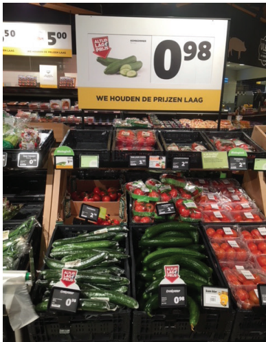
Periode 1: geen bord, zelfde prijs kromme als rechte komkommers